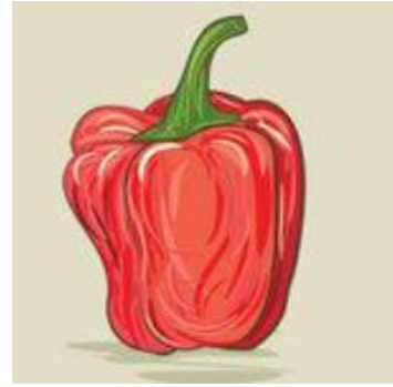
Un poivron rouge