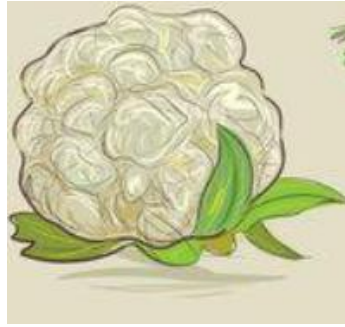
Un chou fleur