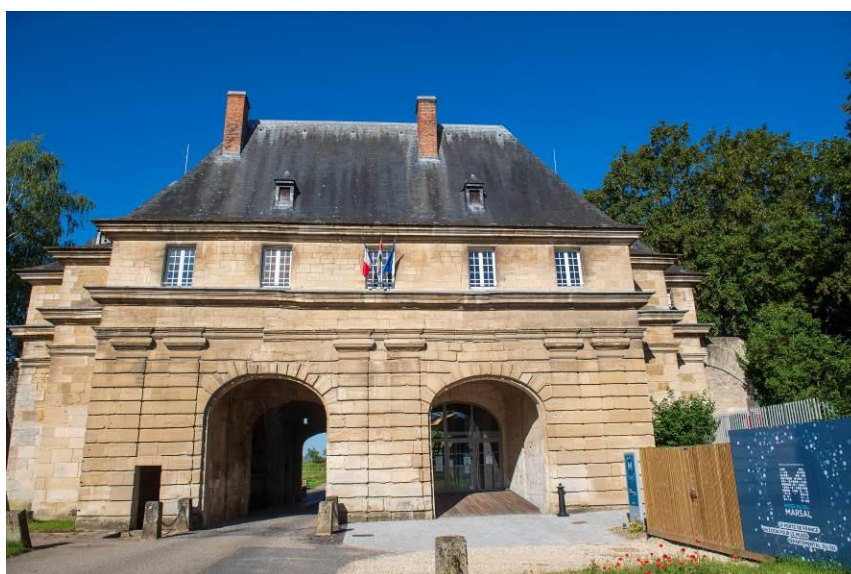
Figure 1 : la Porte de France