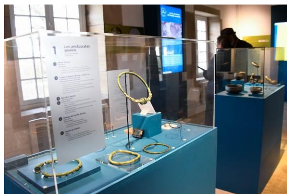
Figure 3 : Bijoux et céramiques celtes

Avec une muséographie renouvelée, les collections du Musée du sel mettent en avant à la recherche archéologique, l'histoire du sel et l'histoire locale. Les élèves sont ainsi confrontés à l'histoire dans sa longue durée mais aussi au niveau du temps court, de l'événement singulier. Ils découvrent comment archéologues et historiens écrivent et réécrivent notre histoire.