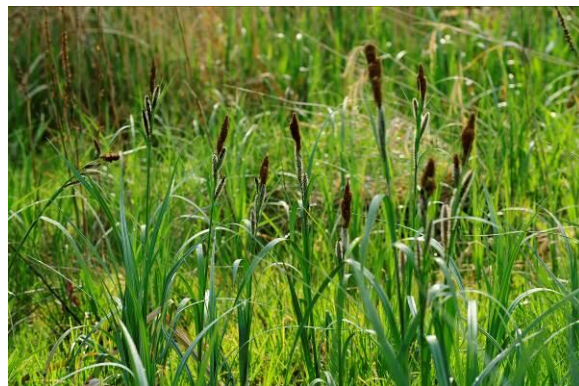
Figure 4 : végétation halophile

Le coût des visites accompagnées et des ateliers est de 3€ par élève et par demi-journée. Ce tarif comprend la prise en charge de l'animation par un médiateur du patrimoine ainsi que la mise à disposition du matériel et des consommables. Les accompagnateurs bénéficient de la gratuité de l'entrée (au plus 1 adulte pour 7 enfants en élémentaire et 1 adulte pour 5 enfants en maternelle).