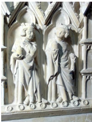
Figure 2 : le Reliquaire de Marsal XIVe siècle - détail

Pour toute demande d'informations ou réservation, le service des publics du Musée départemental du Sel de Marsal est à votre disposition de 9 h 30 à 12 h 30 et de 13 h 30 à 18 h du mardi au vendredi.