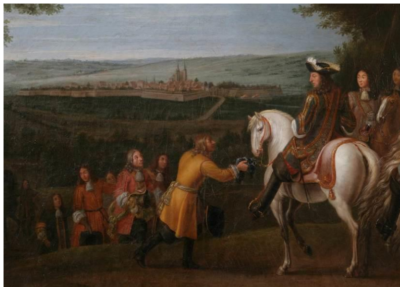
Figure 6 : La reddition de Marsal, Atelier de Van der Meulen