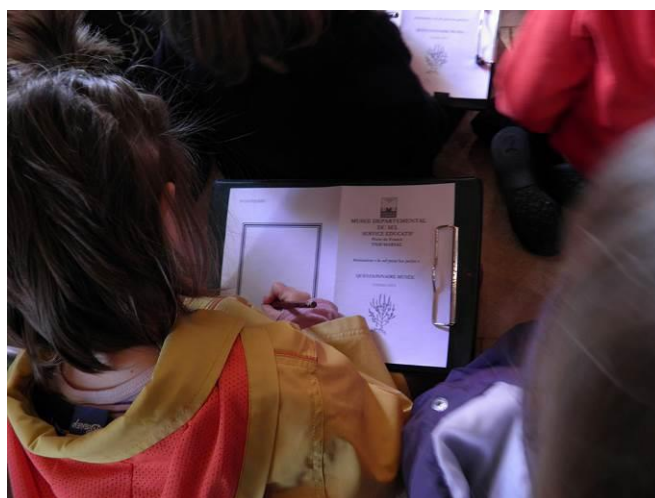
Figure 5 : Groupe d'élèves au travail