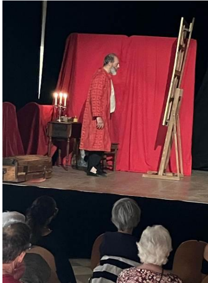
Figure 2 : Pièce de théâtre, Les Nuits Georges de la Tour

Le coût des visites accompagnées et des ateliers est de 3€ par élève et par demi-journée. Ce tarif comprend la prise en charge de l'animation par un médiateur du patrimoine ainsi que la mise à disposition du matériel et des consommables. Les accompagnateurs bénéficient de la gratuité de l'entrée (au plus 1 adulte pour 7 enfants en élémentaire et 1 adulte pour 5 enfants en maternelle).