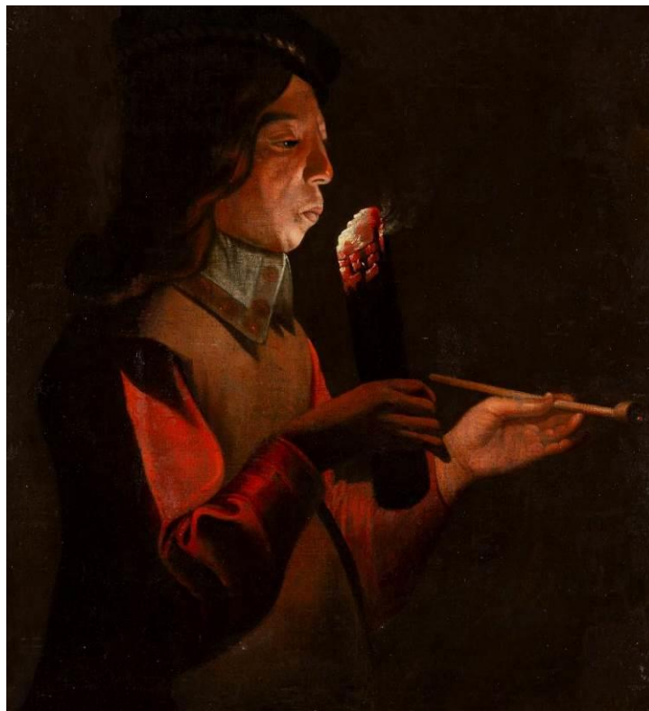
Figure 3 : Le Souffleur à la Pipe , copie ancienne d'après Georges de La Tour

Jean Arp Artiste, Ecrivain, Peintre, Poète, Sculpteur (1886 - 1966)