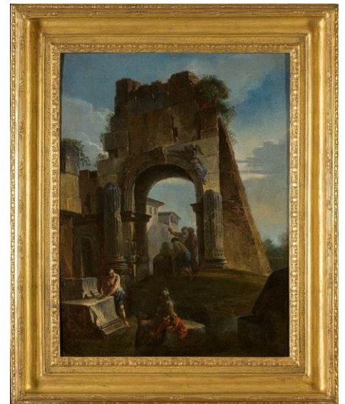
Figure 1 : Caprice Architecturale - Andréa Locatelli - Prêt du MUDAAC d'Epinal

Le prêt de six tableaux du Musée départemental d'art ancien et contemporain d'Épinal nous offre un voyage inédit dans les mondes artistiques de Jean Jouvenet, Andréa Locatelli ou Jan Brueghel Le Jeune.