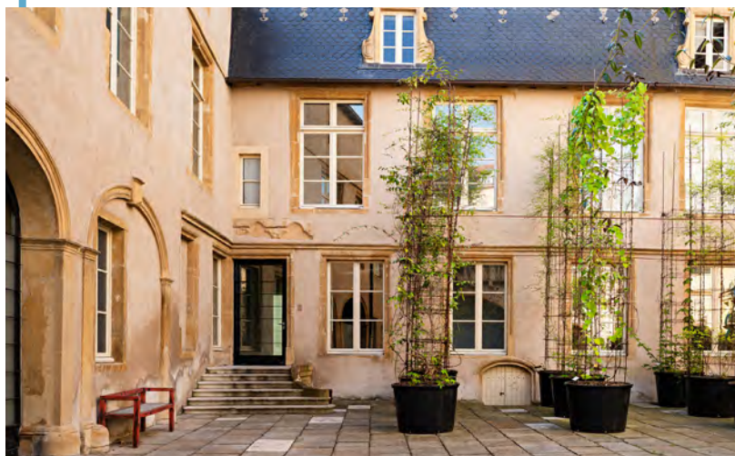
49 Nord 6 Est - Frac Lorraine, Metz

Avec l'échafaudage, le Frac reste accessible aux fauteuils roulants et poussettes de moins de 80cm de large.