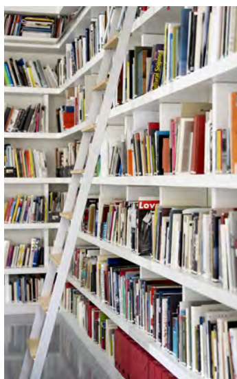
49 Nord 6 Est - Frac Lorraine, Metz

Libre à vous de vous en inspirer afin de poursuivre le développement des compétences en arts plastiques de vos élèves. Les ateliers sont classés par niveaux mais peuvent être adaptés à tous.tes.