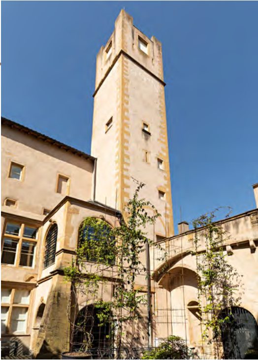
49 Nord 6 Est - Frac Lorraine