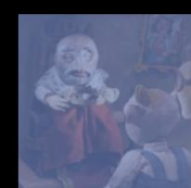
Séquence 9 | 04:54