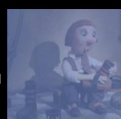
Séquence 7 | 02:48

GÉNÉRIQUE AUTOUR DU FILM LE POINT DE VUE DE L'AUTEUR-RICÉ DEROULANT ANALYSE DE SÉQUENCE IMAGE RICOCHET