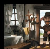
Séquence 8 | 03:12