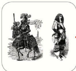
Membres de la noblesse