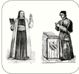
Hommes du clergé

les membres de la noblesse – les hommes du clergé – les paysans.