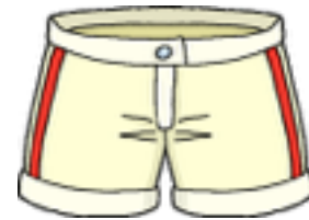
die kurze Hose