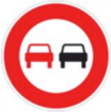
Interdiction de dépasser

C'est le pictogramme noir, situé à l'intérieur, qui indique la nature de l'interdiction