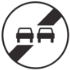
Fin d'interdiction de dépasser