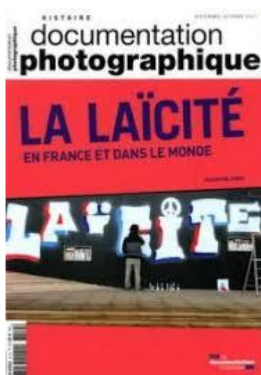
La documentation photographique n°8119

https://eduscol.education.fr/pid23591/la-laicite-a-l-ecole.html