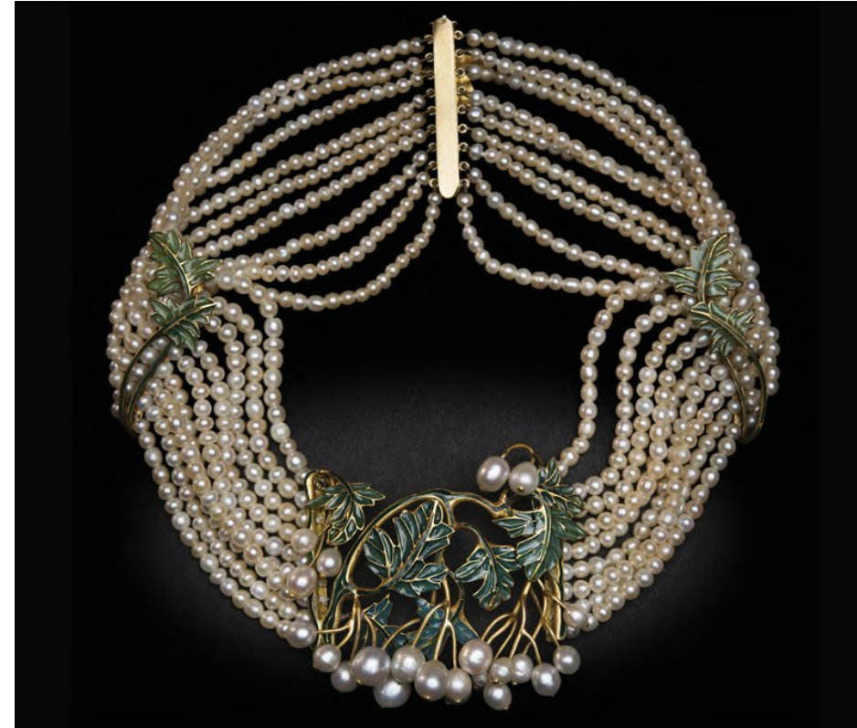
Collier de chien, Aubépine (1902-1904) Collection privée