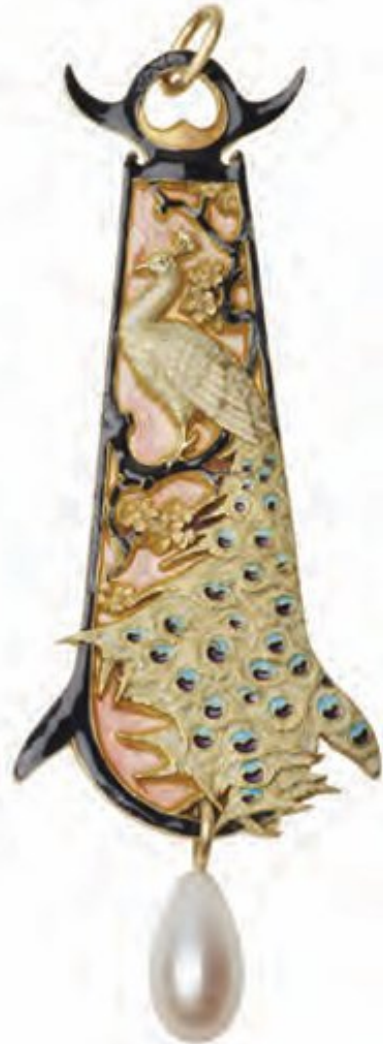
LALIQUE René Pendentif Paon et branche de prunus v. 1900-1902 Coll. privée