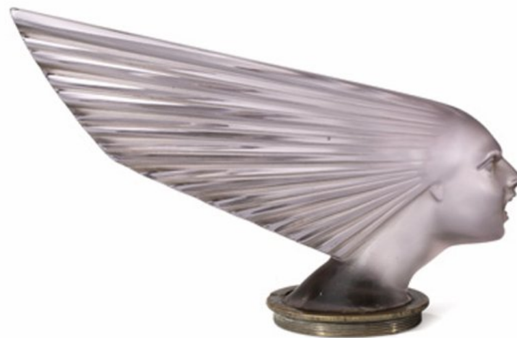
Bouchon de radiateur Victoire - 1928 - Musée Lalique