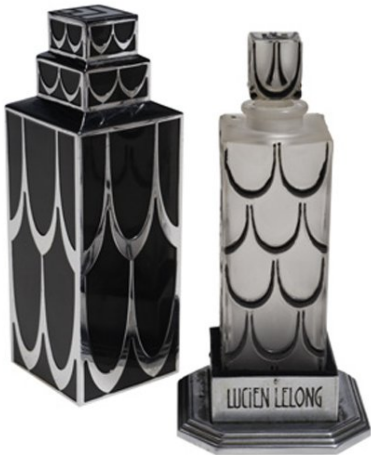
Flacon de parfum Lucien Lelong - Coll. Benjamin Gastaud