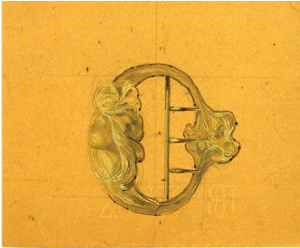
boucle de ceinture, Visage de femme 1900 collection privée