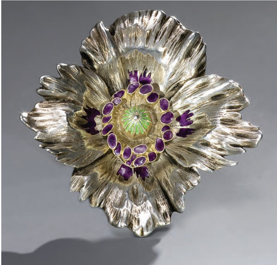
Boucle de ceinture, Pavot (1895)