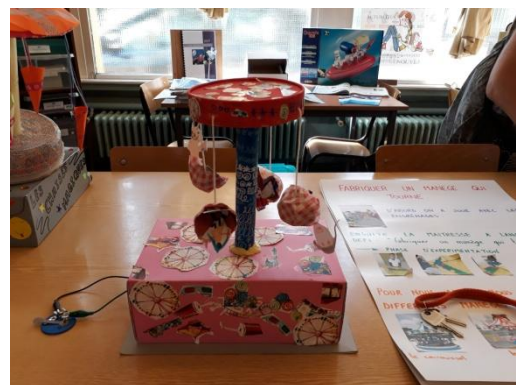
Classe de CP