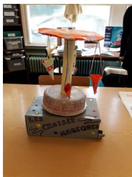
Classe de CE2