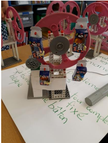
Classe de CP