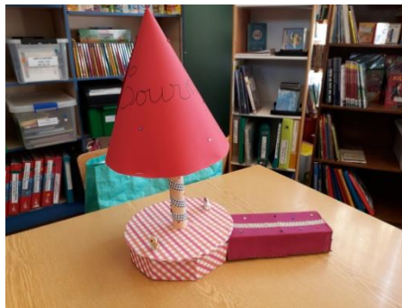
Classe de CE2