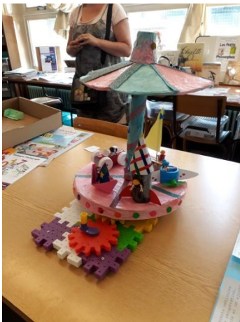
Classe de GS