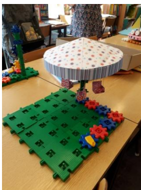
Classe de GS