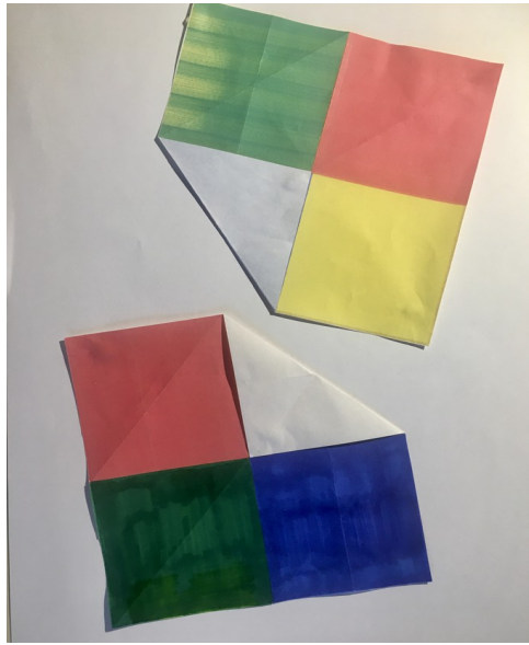
Un carré avec deux pliages