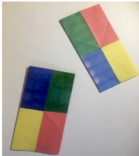
2 rectangles avec deux pliages