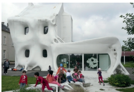
Gue(ho)st House, commande publique de Berdaguer & Péjus, 2012.

Parallèlement, la mission de soutien à la création et à la diffusion passe par une politique éditoriale. Le centre d'art co-édite des livres d'artistes, des multiples, des monographies en lien avec les expositions, manière de faire rayonner autrement le travail mené sur place.