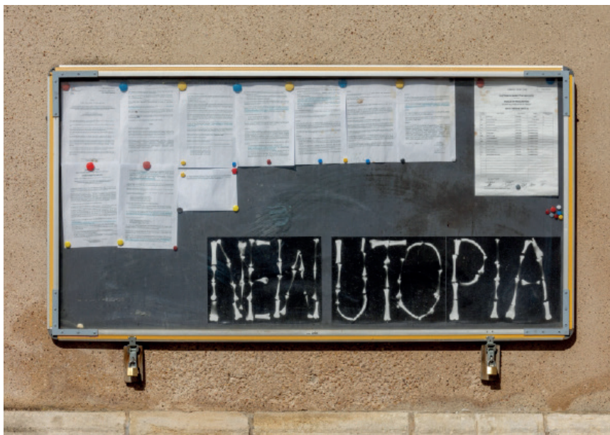
Gina Folly, NEW UTOPIA , 2021, photographes d'os d'animaux et panneau d'affichage verrouillé en aluminium.