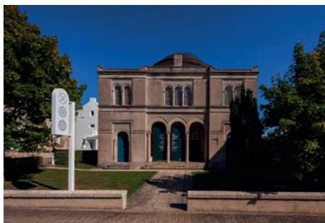
La synagogue de Delme.