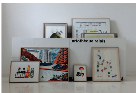
L'artothèque-relais, située dans la Gue(ho)st House.

Située à l'arrière de la synagogue, la Gue(ho)st House est une architecture-sculpture réalisée par les artistes Christophe Berdaguer et Marie Péjus. Ils ont transformé une maison existante qui fût tour à tour prison, école et chambre funéraire en lieu dédié à l' action pédagogique . Elle permet d'accueillir les ateliers artistiques, les rencontres avec des artistes, des événements (lectures, concerts, projection, etc.).