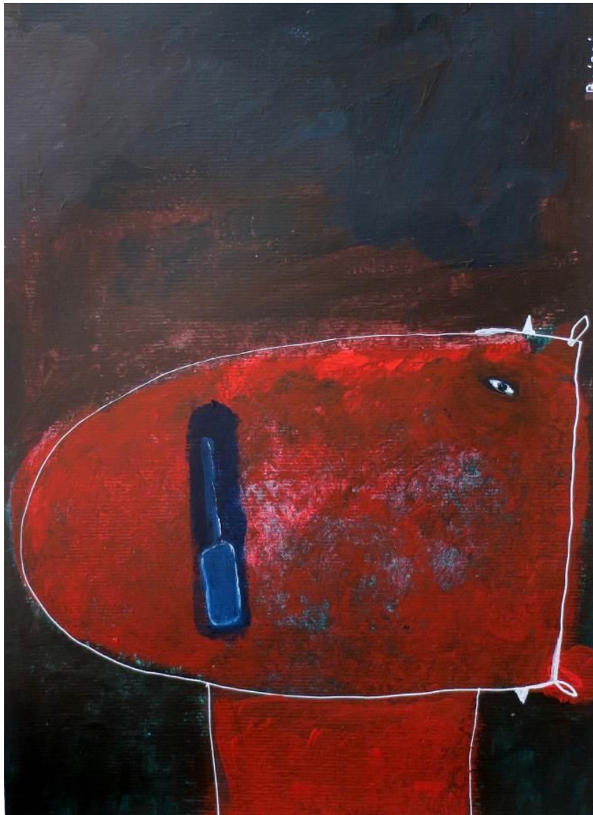
Figure 4 : Toro , Alain Brizzi

« Pour moi la modestie du lieu et la pauvreté des matériaux me stimulent davantage qu'un certain confort dans les conditions de travail.