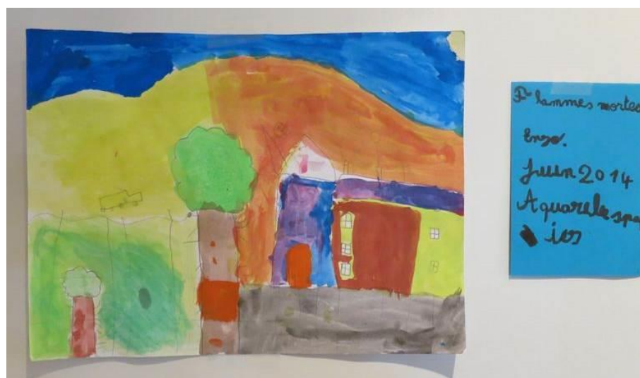
Figure 3 : réalisation en atelier

Le coût des visites accompagnées et des ateliers est de 3€ par élève et par demi-journée. Ce tarif comprend la prise en charge de l'animation par un médiateur du patrimoine ainsi que la mise à disposition du matériel et des consommables. Les accompagnateurs bénéficient de la gratuité de l'entrée (au plus 1 adulte pour 7 enfants en élémentaire et 1 adulte pour 5 enfants en maternelle).