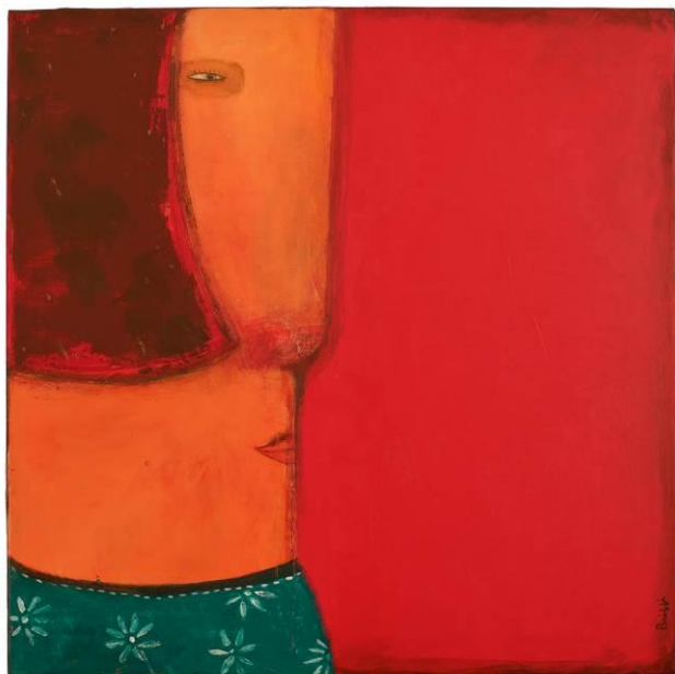
Figure 2 : La Femme du Clown , Alain Brizzi

Cette exposition est parfaitement adaptée aux élèves d'élémentaire et de maternelle. Elle permet une rencontre ludique et dynamique avec l'univers singulier d'un artiste contemporain. Elle suscite aussi une réflexion sur la mise en regard et en espace des œuvres.