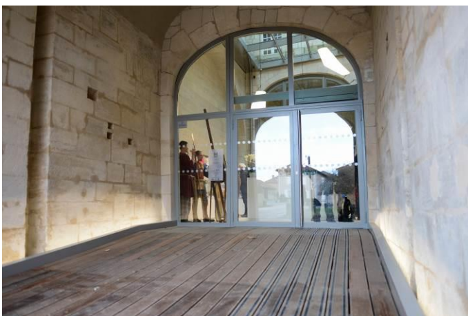
Figure 6 : Le nouvel accueil du Musée départemental de Marsal

Les accompagnateurs bénéficient de la gratuité de l'entrée (au plus 1 adulte pour 7 enfants en élémentaire et 1 adulte pour 5 enfants en maternelle)