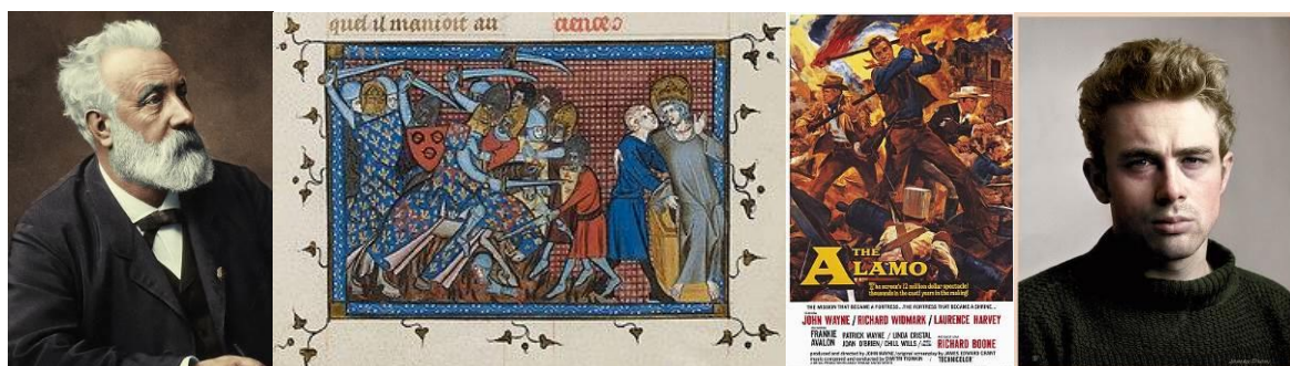
Figure 1 - Le 8 février : Jules Verne, Saint Louis guerroyant – Affiche du film « Alamo » - James Dean et...