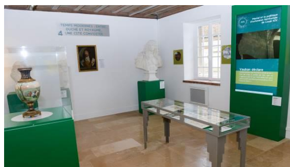
Figure 4 : une muséographie renouvelée, la salle des Temps Modernes

Avec une muséographie renouvelée, les collections du Musée du sel font la part belle à la recherche archéologique, l'histoire du sel et l'histoire locale. Les élèves sont ainsi confrontés à l'histoire dans sa longue durée mais aussi au niveau du temps court, de l'événement. Ils découvrent comment archéologues et historiens écrivent et réécrivent notre histoire. Enfin, un site naturel unique, la mare salée, est à la base d'activités associant l'étude du milieu, la zoologie et l'initiation au développement durable.