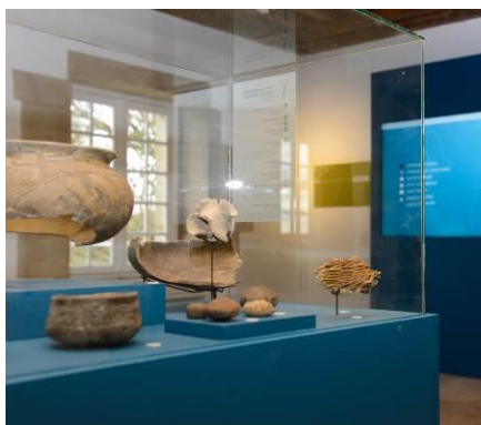
Figure 3 : le musée du Sel - détail

Le musée sera ouvert tous les jours sauf le lundi, de 9 h 30 à 12 h 30 et de 13 h 30 à 18 h.