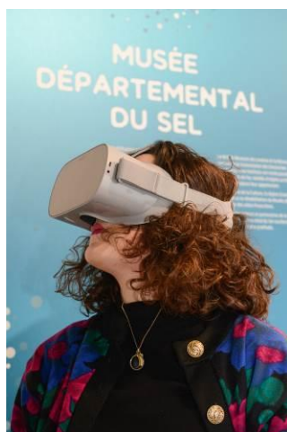
Figure 2 : Musée départemental du Sel