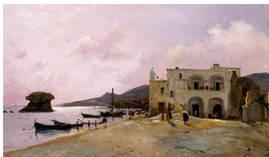
Figure 2 : Vue prise de Mergellina – Benjamin de Francesco

Le musée départemental Georges de La Tour est ouvert du mardi au dimanche de 9 h 30 à 12 h 30 et de 13 h 30 à 18 h00. La fermeture annuelle est prévue du 15 décembre au 9 février.