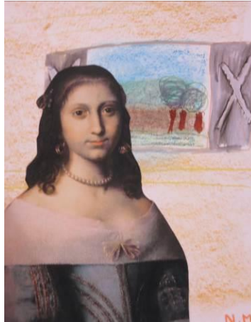
Figure 4 : Travail en atelier sur le portrait

Le coût des visites accompagnées et des ateliers est de 3€ par élèves et par demi-journée. Ce tarif comprend la prise en charge de l'animation par un médiateur du patrimoine ainsi que la mise à disposition du matériel et des consommables. Les accompagnateurs bénéficient de la gratuité de l'entrée (au plus 1 adulte pour 7 enfants en élémentaire et 1 adulte pour 5 enfants en maternelle)