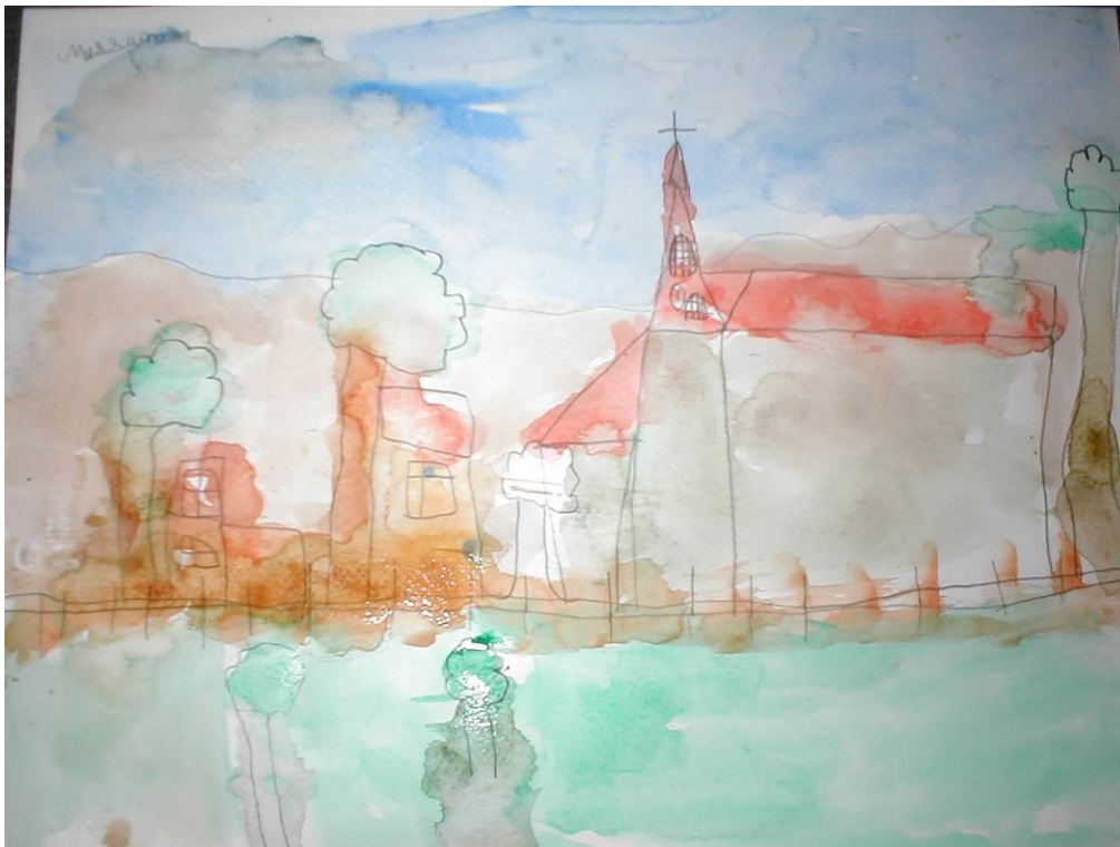
Figure 1 : le paysage, élève de GS

Le musée départemental Georges de La Tour se trouve à Vic-sur-Seille, ville natale de l'artiste. Il est l'écrin d'une collection d'œuvres du XVII e au XXI e siècle. Peintures, sculptures et photographies prennent place dans un bâtiment conçu par l'architecte Vincent Brossy.