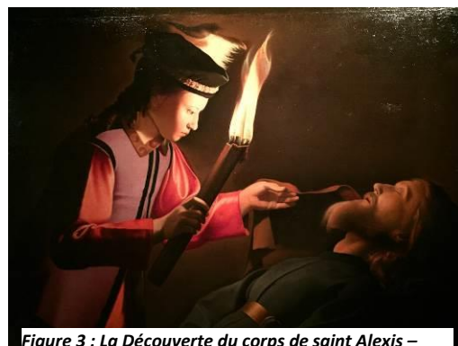
Figure 3 : La Découverte du corps de saint Alexis – Détail - Palais de Ducs de Lorraine Musée Lorrain

Georges de La Tour est bien représenté avec deux peintures originales et plusieurs tableaux qui peuvent être attribués à son atelier (dont La découverte du corps de saint Alexis prêté par le Palais des Ducs de Lorraine/Musée Lorrain et Le Reniement de saint Pierre prêté par un particulier). Le musée bénéficie de partenariats ponctuels avec le Centre Pompidou Metz et le Centre d'Art Contemporain de Delme.