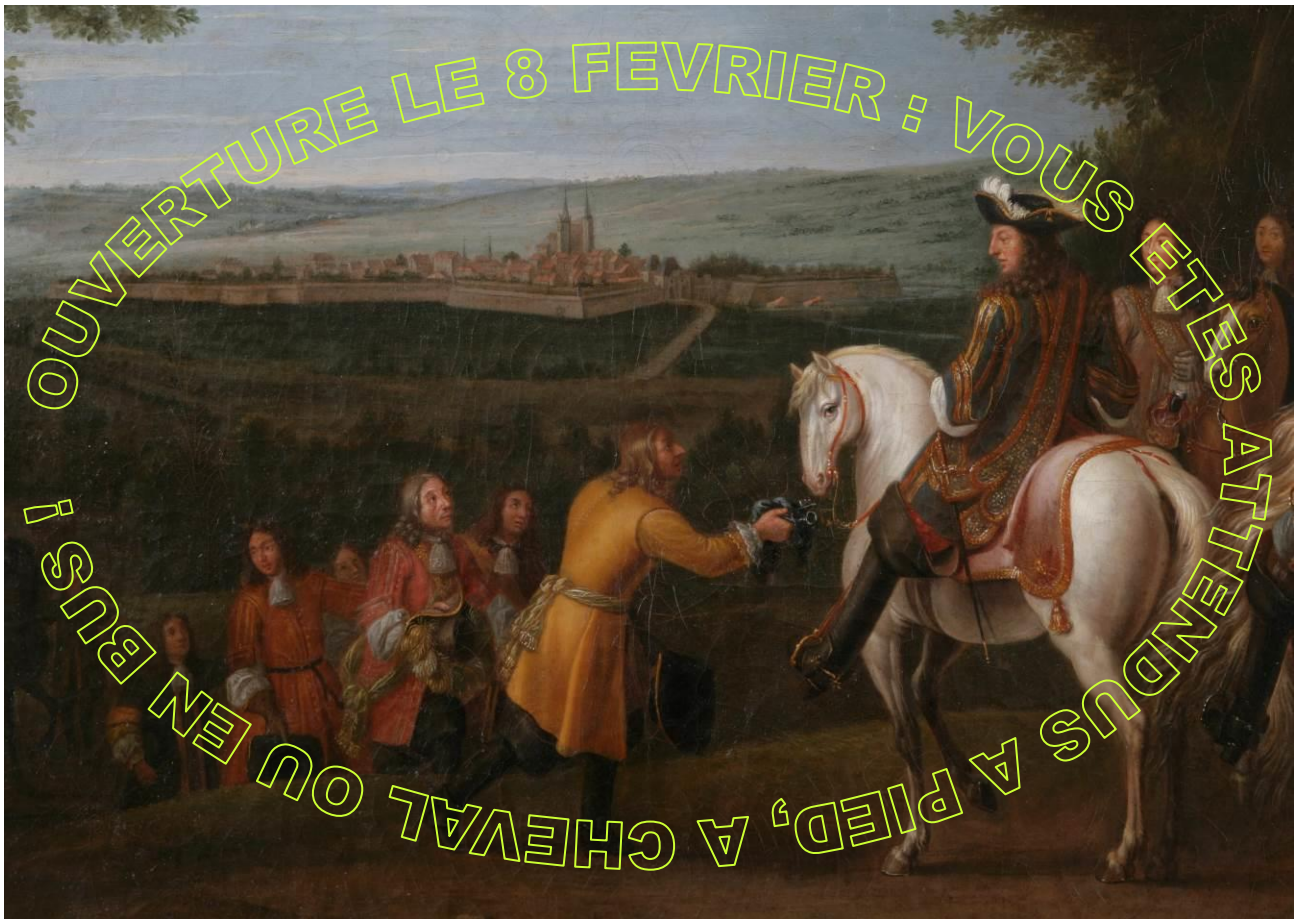
Figure 6 : La reddition de Marsal, Atelier de Van der Meulen