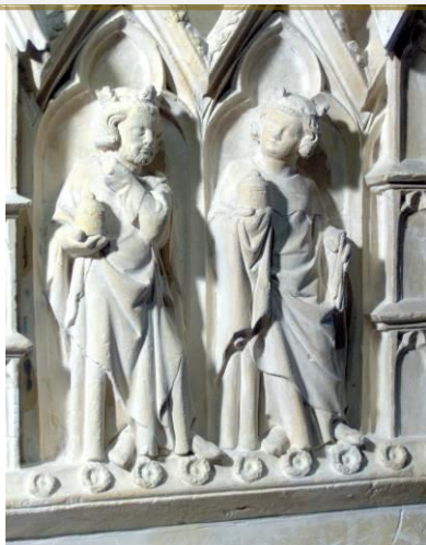
Figure 2 : le Reliquaire de Marsal XIVe siècle - détail

Le musée sera ouvert tous les jours sauf le lundi, de 9 h 30 à 12 h 30 et de 13 h 30 à 18 h.