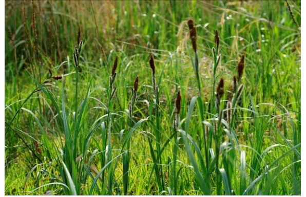
Figure 4 : végétation halophile

Le coût des visites accompagnées et des ateliers est de 3€ par élèves et par demi-journée. Ce tarif comprend la prise en charge de l'animation par un médiateur du patrimoine ainsi que la mise à disposition du matériel et des consommables. Les accompagnateurs bénéficient de la gratuité de l'entrée (au plus 1 adulte pour 7 enfants en élémentaire et 1 adulte pour 5 enfants en maternelle)