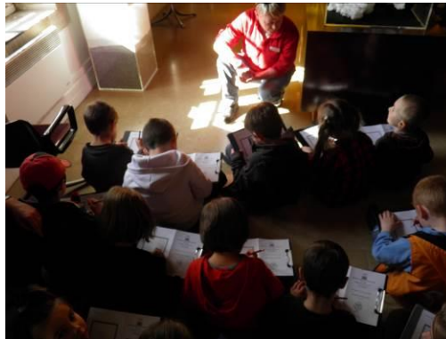
Figure 5 : Groupe d'élèves au travail