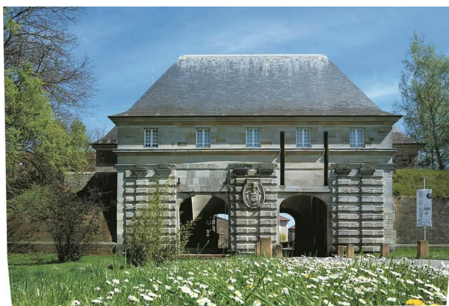
Figure 1 : la Porte de France avant les nouveaux aménagements...