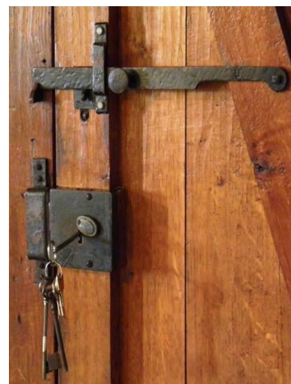
Figure 3 : les portes du musée s'ouvriront sur une muséographie renouvelée