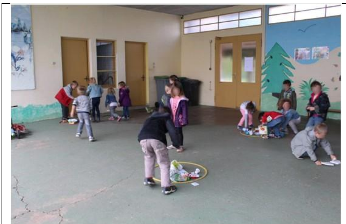
Photo des élèves jouant au jeu