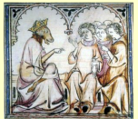
Roman de Fauvel, Gervais du Bus, France, XIV e siècle

-Établir des liens entre des créations littéraires et artistiques issues de cultures et d'époques diverses.