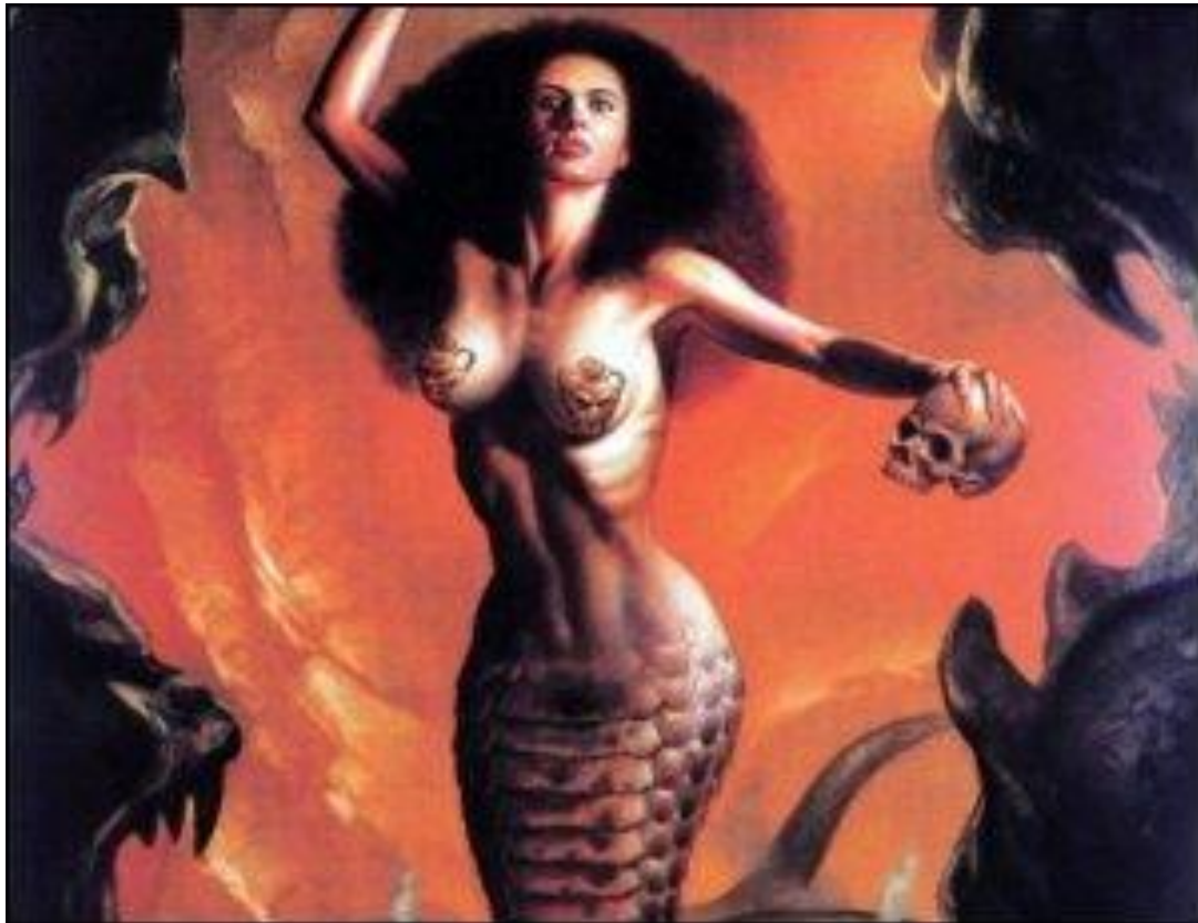
Echnida B. VALLEJO 1991

Mais surtout elle passait pour avoir donné le jour avec Typhon et Orthros aux créatures fabuleuses de la mythologie grecque comme Chimère ou Sphinx sans qu'on ne sache pas très bien qui sont les géniteurs.