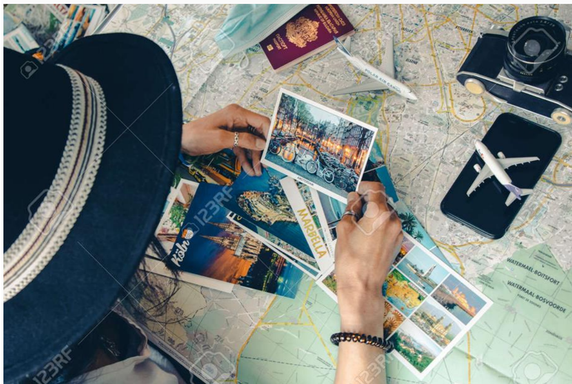
Document 2 : photo, Voyages et nostalgie, anonyme