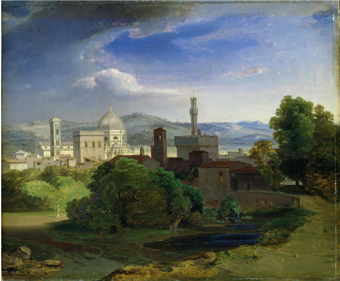
Document 2 : Carl Rottmann, Vue de Florence ,Huile sur toile, 36,3 x 43,6 cm, vers 1829, Kunsthalle, Hambourg