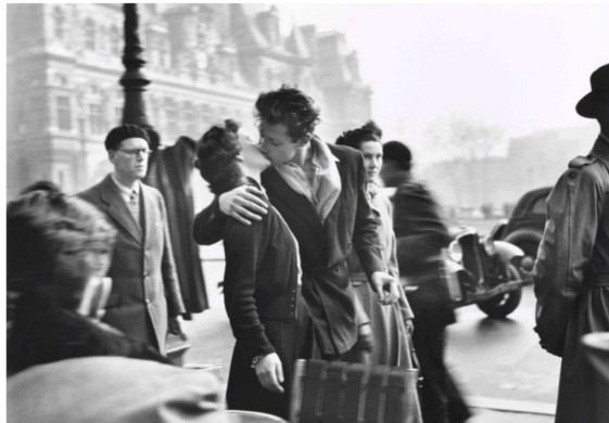
Baiser de l'Hôtel de Ville , Robert Doisneau (1950)

Il se manifeste d'abord par des troubles du comportement comme de l'agressivité envers soi ou envers les autres, des délires. Il existe aussi des états d'angoisse très forts, conduisant à une dépersonnalisation, voire à une dissociation. Pour apaiser ces symptômes, un traitement médicamenteux ou un soutien psychologique doivent être envisagés.