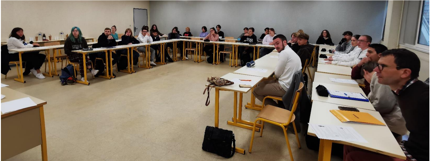
Un représentant par classe de la Seconde au BTS et un éco-délégué de l'internat

Premier contact, présentation des enjeux et de l'organisation