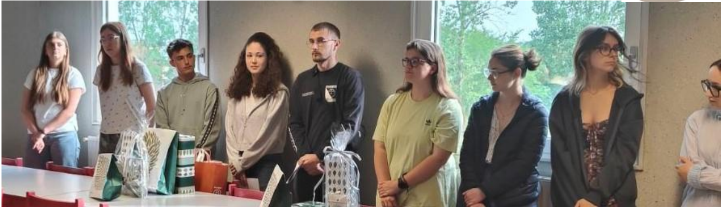
Le jury (éco-délégués et membres de la MDL) présent pour distribuer les récompenses