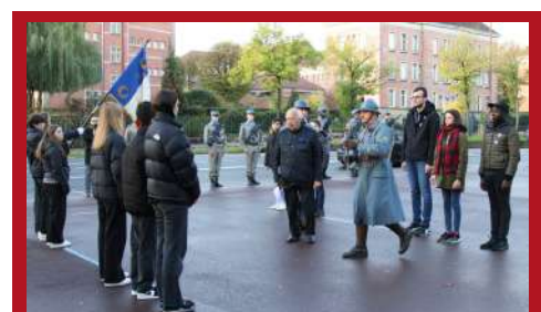
Passation du flambeau