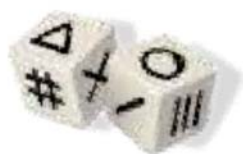
2 dés avec 6 symboles différents