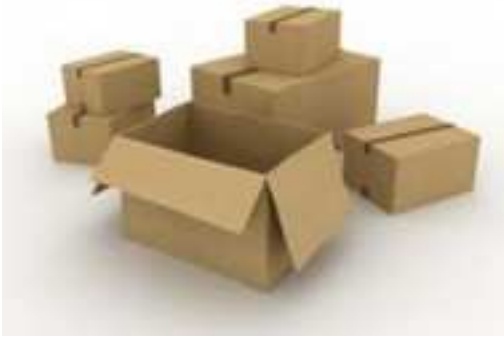
Cartons d'expédition à utiliser selon les besoins