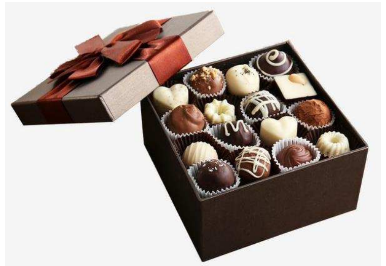
Ballotin à deux niveaux à garnir (exemple de remplissage avec des chocolats quelconques)