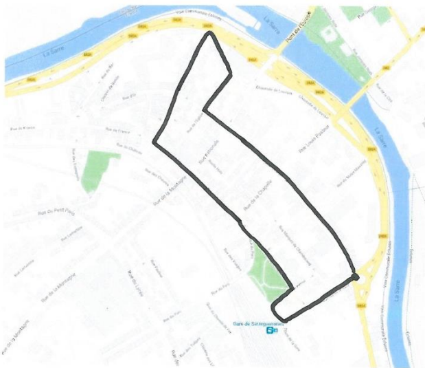
Annexe 1 Le plan du centre-ville

Nous avons tracé le circuit de la cavalcade. Nous avons trouvé qu'il ressemblait beaucoup plus au troisième schéma qu'aux autres. Sur le schéma, le départ au rond-point de la rue Poincaré se trouve en bas à droite.