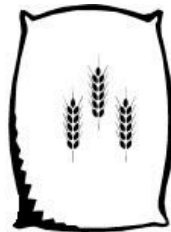
Der Müller macht Mehl.