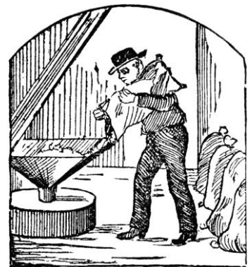
Das ist der Müller.