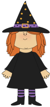
Das ist die Hexe: