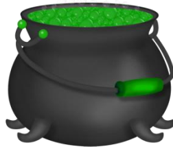
Die Hexe hat einen Hexenkessel: