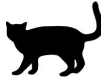
Das ist die schwarze Katze: