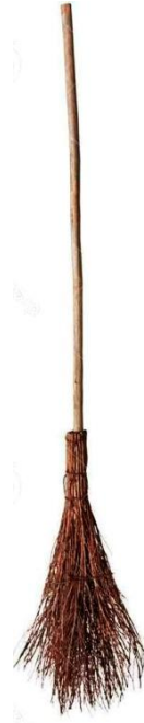
Die Hexe hat einen Besen: