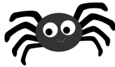
Eine Spinne ist in der Küche: