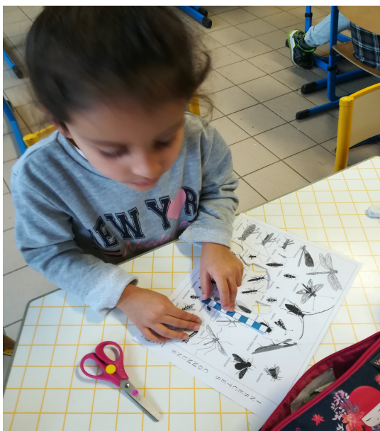
On mesure les insectes.

=> Nous utiliserons des feuilles de couleurs (a4, a5, a6) adaptées à la taille de la collection, il faudra bien les répartir sur la feuille (en ligne, en colonne, comme des constellations du dé...)