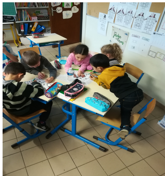
On entoure ceux qui correspondent aux critères de taille