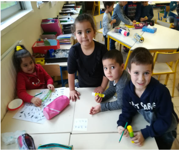
On place puis on colle les insectes.