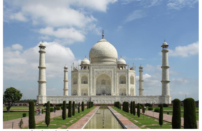
Le Taj 'Mahal

Après ce merveilleux tour du monde, elle décide de rentrer chez elle. Problème : son passeport est dans sa valise... verrouillée !