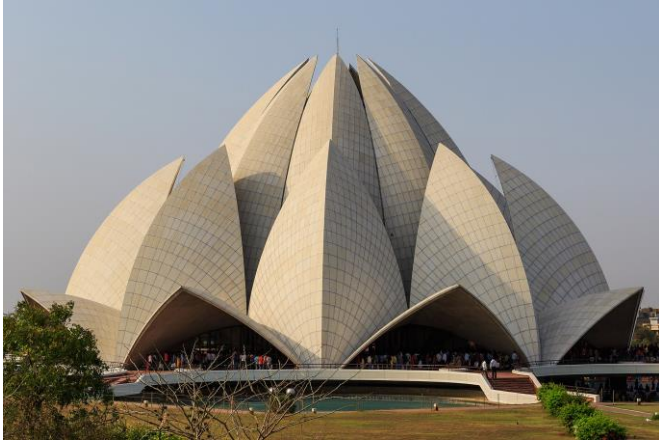
Temple du Lotus à New Dehli