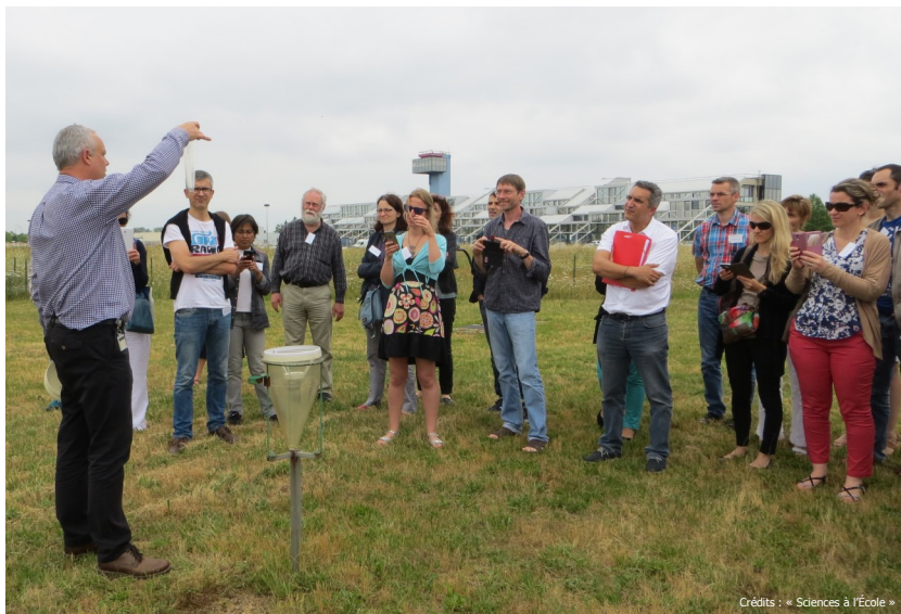
Visite du parc des instruments

Après l'appel à candidatures conduit à la fin de l'année 2015 dans le cadre du Programme d'Investissements d'Avenir (PIA) , 25 nouveaux établissements scolaires (sur les 95 candidats) ont bénéficié d'un prêt de station météorologique et ont rejoint le réseau « MÉTÉO à l'École ». Les équipes sélectionnées ont pu bénéficier d'une formation du 6 au 9 juin 2016 à l' École Nationale de la Météorologie (ENM) de Météo-France. Au cours de ce stage de formation, les enseignants de l'opération ont pu notamment acquérir des notions de base en météorologie, comprendre le fonctionnement de leurs stations météorologiques, acquérir les compétences de base nécessaires à la mise en œuvre de leurs projets, partager leurs idées d'activités.