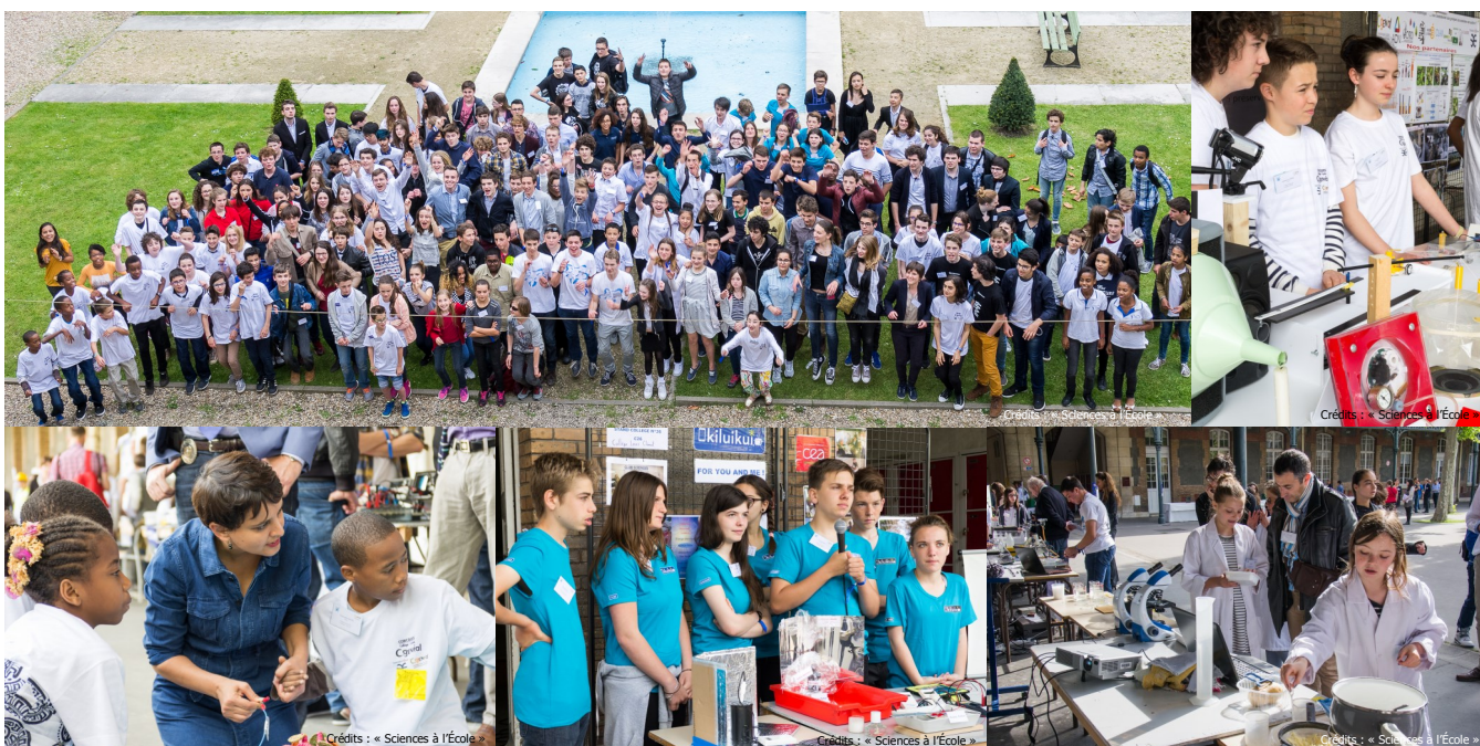
Différents moments de la finale, dont l'échange de madame la ministre avec les collégiens mahorés

Le 21 mai 2016, 52 équipes venues de la France entière et d'établissements français à l'étranger ont participé à la grande finale nationale du « Concours C.Génial » au lycée Janson-de-Sailly (Paris 16 ème ). Vingt-et-une équipes de lycéens des voies générale, technologique et professionnelle et 31 équipes de collégiens ont présenté leurs projets au public, aux membres du jury, ainsi qu'à Madame Najat Vallaud-Belkacem, ministre de l'Éducation nationale, de l'Enseignement supérieur et de la Recherche , qui a honoré la finale de sa présence.