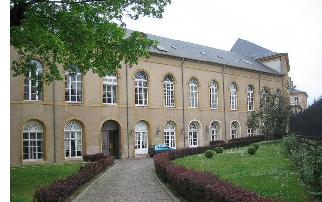
Ecole du Génie de Metz