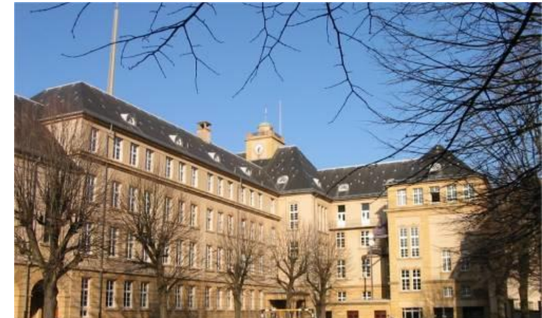
Site des Cours de Victor Poncelet, actuel lycée Louis VINCENT

Il est élu à l'Académie des Sciences en 1834 et député de la Moselle en 1848 à la chute de la Monarchie de Juillet. Arago qui est alors ministre le nomme Général de Brigade et Commandant de l'Ecole Polytechnique.