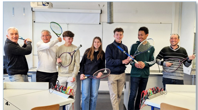
Parmi les 50 projets qualifiés en finale nationale : 1. Tous de mèche pour recycler (Collège Lucie Aubrac, Rieupeyroux, académie de Toulouse) ; 2. L'énergie à dos d'âne (Collège Le Chamandier, Gières, académie de Grenoble) ; 3. « Zéro déchet » Oublie ta bouteille prends ta gourde – Zéro déche, bliyé to boutey, pran to gourd ! (Lycée Gaston Monnerville, Kourou, académie de Guyane) ; 4. Jouer sans trembler (LP2I - Lycée Pilote Innovant International, Jaunay-Marigny, académie de Poitiers).