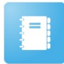
Cahier de textes

Tutoriels d'accompagnement : Aide et Support de l'ENT One